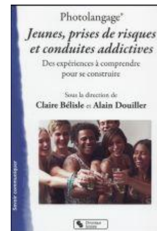
Photolangage ; jeunes, prises de risques et conduites addictives