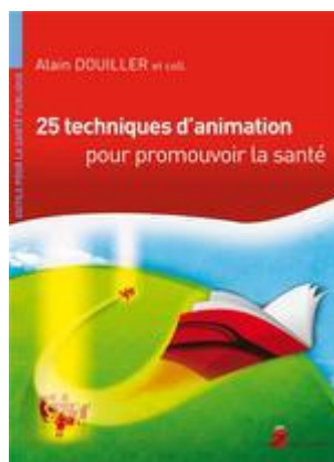
25 techniques d'animation pour promouvoir la santé

Il est le co-auteur du guide 25 techniques d'animation pour promouvoir la santé (2005) et de 2 Photolangage® avec Claire Belisle et une vingtaine de professionnels de l'éducation pour la santé de la Région Provence Côte d'Azur : Photolangage jeunes et alimentation – Pour penser ce que manger veut dire (2013) et Jeunes, prises de risques et conduites addictives (2016) chez Chronique sociale.